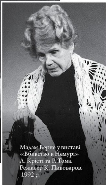
Мадам Верне у виставі «Вбивство в Немурі» А. Крісті та Р. Тома. Режисер К. Пивоваров. 1992 р.