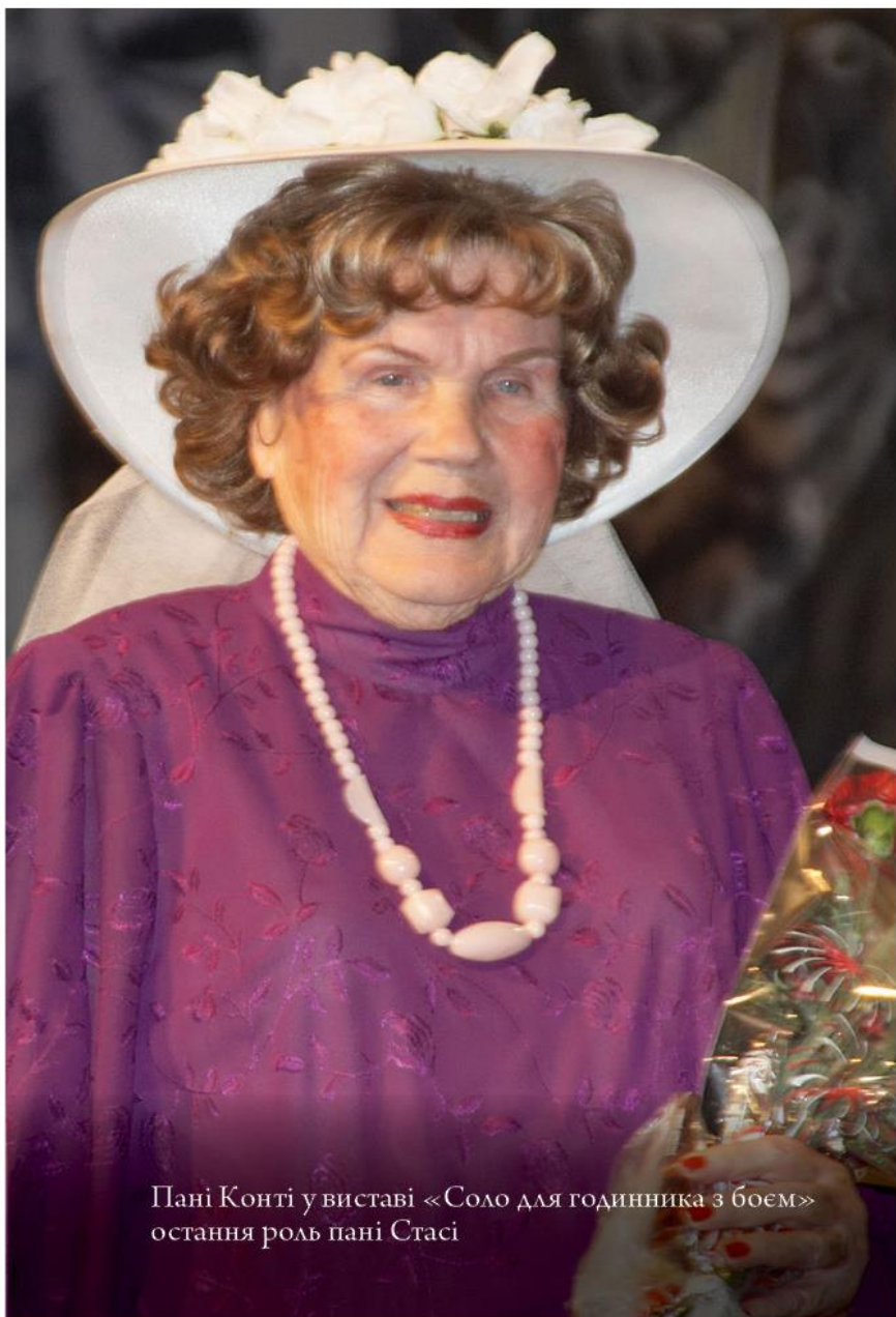
Пані Конті у виставі «Соло для годинника з боєм» остання роль пані Стасі