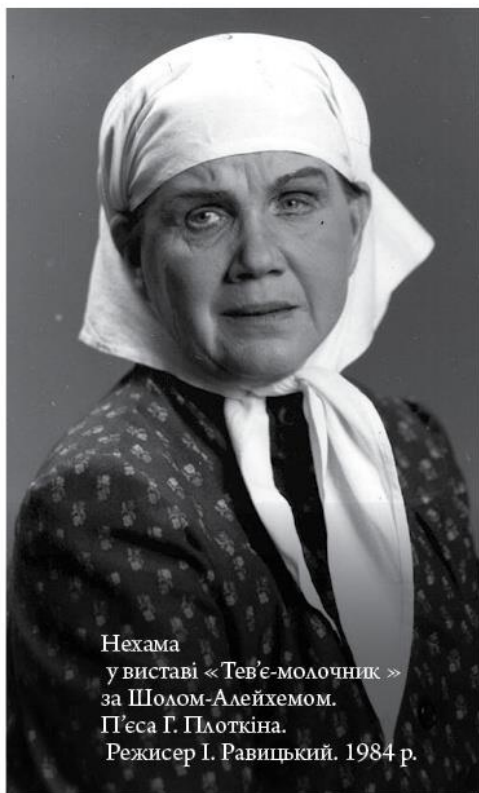
Нехама у виставі «Тев'є-молочник» за Шолом-Алейхемом. П'єса Г. Плоткіна. Режисер І. Равицький. 1984 р.