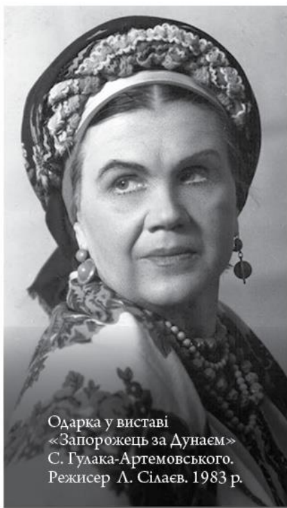
Одарка у виставі «Запорожець за Дунаєм» С. Гулака-Артемовського. Режисер А. Сілаєв. 1983 р.

В житті трапляється все: смужка біла, далі – чорна, сумне і веселе, радість і лихо. Комедія і трагедія крокують недалеко одна від одної.