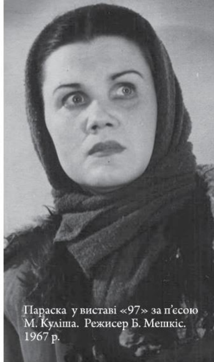
Параска у виставі «97» за п'єсою М. Куліша. Режисер Б. Мешкіс. 1967 р.