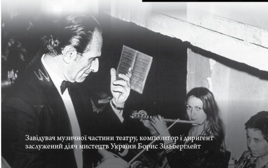
Завідувач музичної частини театру, композитор і диригент заслужений діяч мистецтв України Борис Зільберглейт