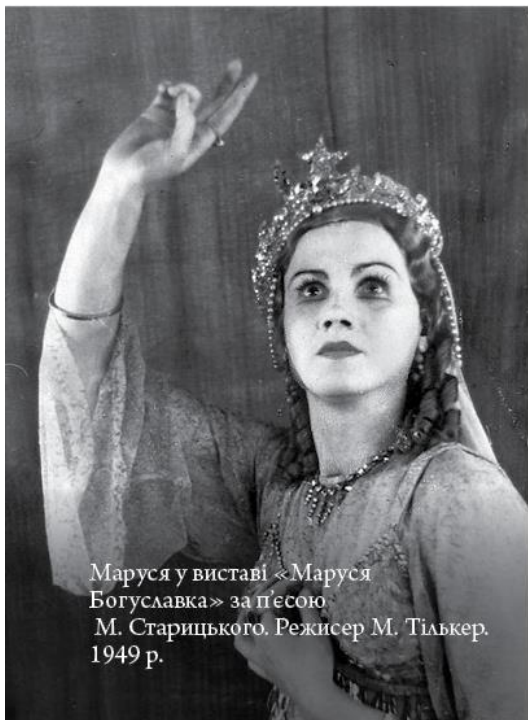
Маруся у виставі «Маруся Богуславка» за п'єсою М. Старицького. Режисер М. Тількер. 1949 р.

А тоді я грала чи не щовечора. Кожен вечір був святом. Грала, танцювала, співала.