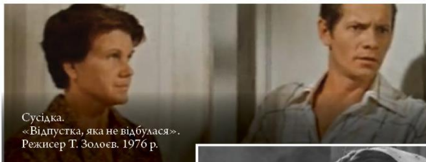
Сусідка. «Відпустка, яка не відбулася». Режисер Т. Золоєв. 1976 р.