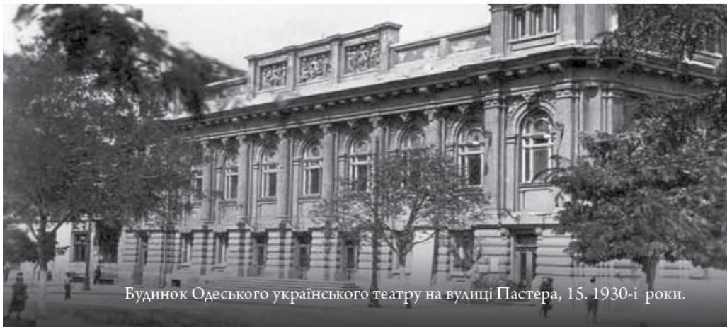
Будинок Одеського українського театру на вулиці Пастера, 15. 1930-і роки.