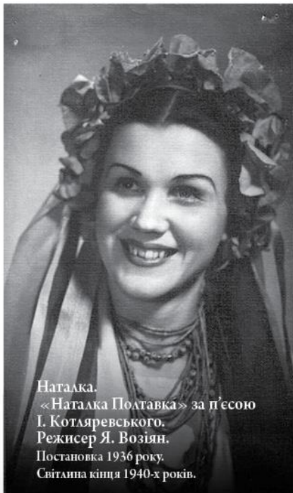
Наталка. «Наталка Полтавка» за п'єсою І. Котляревського. Режисер Я. Возія. Постановка 1936 року. Світлина кілля 1940-х років.