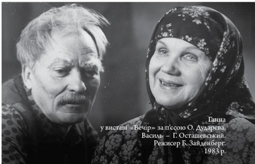
Ганна у виставі «Вечір» за п'єсою О. Дударєва. Василь – Г. Осташевський. Режисер Б. Зайденберг. 1983 р.