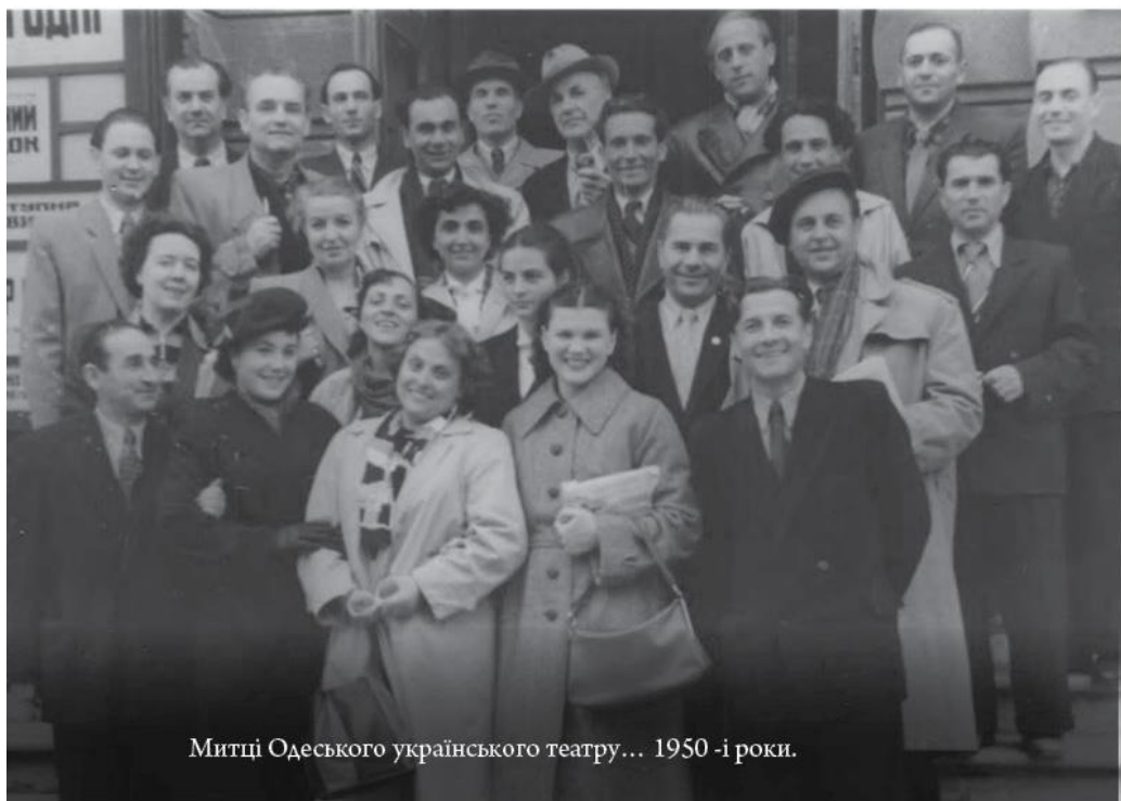
Митці Одеського українського театру... 1950-і роки.

Як би Ви знали, скільки було в моєму житті щастя, творчості, зустрічей... Безліч.