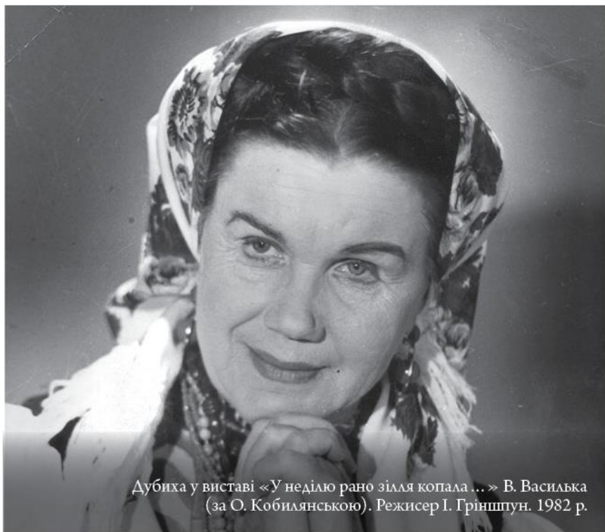
Дубиха у виставі «У неділю рано зілля копала ...» В. Василька (за О. Кобилянською). Режисер І. Гріншпун. 1982 р.

Народилася я в світлий день Благовіщення – 7 квітня 1920 року – в Одесі, в прекрасній родині... Тож, все в житті мало бути щасливим. Від самого початку.