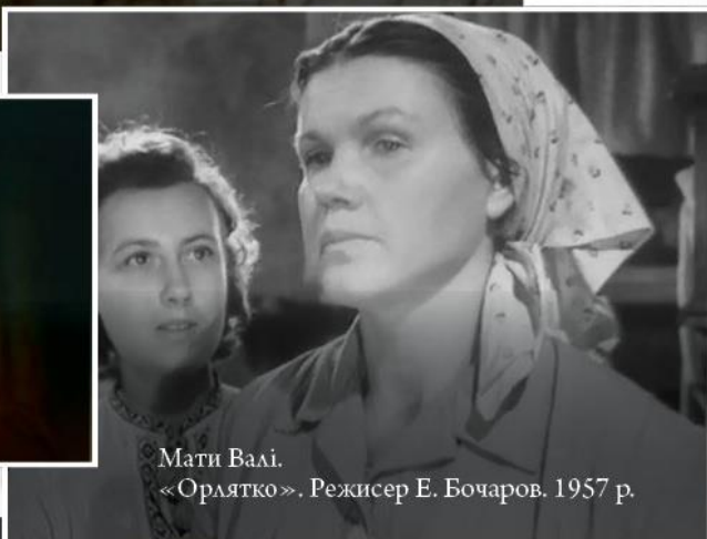
Мати Валі. «Орлятко». Режисер Е. Бочаров. 1957 р.