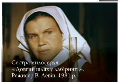
Сестра милосердя. «Довгий шлях у лабіринті». Режисер В. Левін. 1981 р.